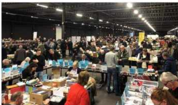
Oudjaarsbeurs Houten 5500m 2 verzamelplezier (foto december 2022).

Geopend 28/12 9.30-17 uur / 29/12 09.30-16 uur